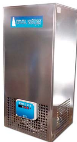
CW 100 / 200 / 300 / 500