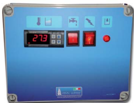
ПАНЕЛЬ УПРАВЛЕНИЯ CWR