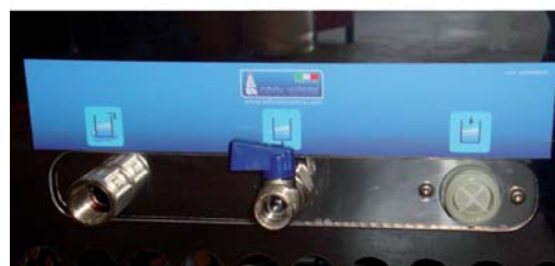
СОЕДИНЕНИЯ ТРУБ ВХОД -ВЫХОД