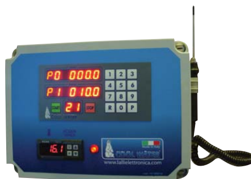
ПАНЕЛЬ УПРАВЛЕНИЯ CWR – D CWR -RD